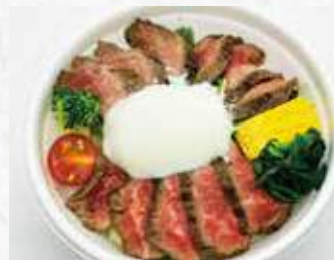
ローストビーフ丼