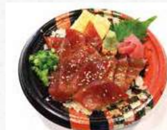
漬けマグロ丼 白米又は酢飯