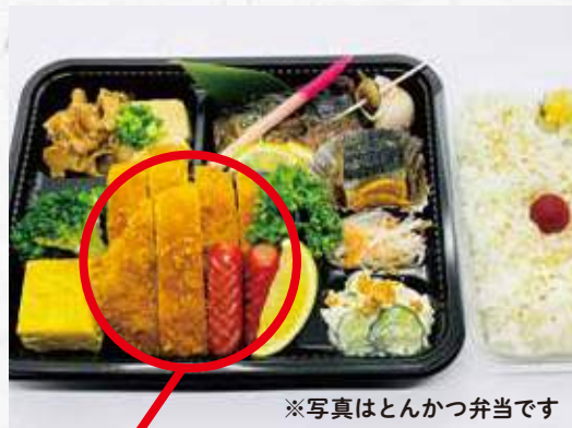
※写真とはんかつ弁当です