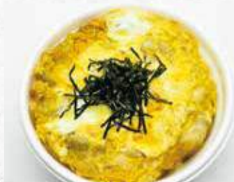
親子丼(鶏モモ・鶏皮)