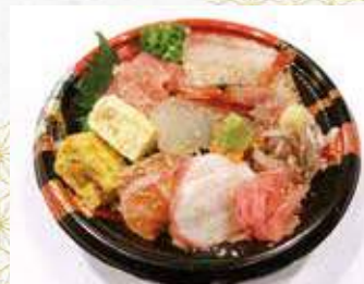
海鮮丼 白米又は酢飯