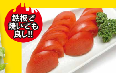
トマトスライス 380円+税