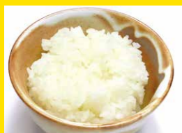
ライス 大 200円+税 中 150円+税 小 100円+税