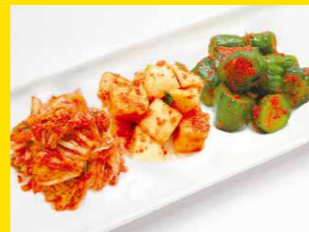
キムチ盛り合せ 720円+税