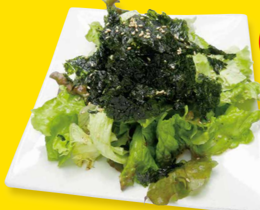
チョレギサラダ 680円+税