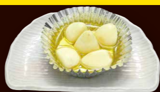
つぶニンニク 320円+税