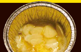
ガーリックバター 320円+税