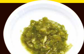
きざみわさび 320円+税