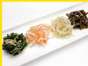
ナムル盛り合せ 680円+税