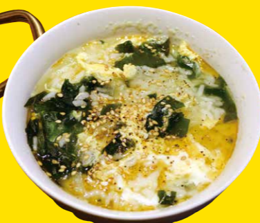
ワカメと玉子クッパ (辛無) 680円+税