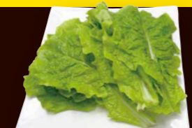
サンチュ(味噌つき) 320円+税