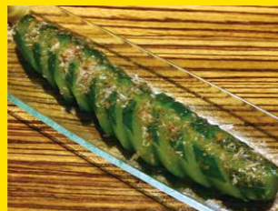
きゅうりの1本漬け 380円+税