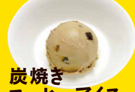
炭焼き コーヒーアイス 270円+税