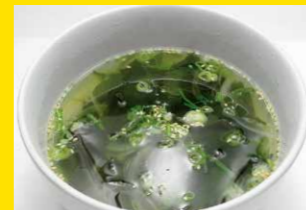
ワカメスープ 480円+税