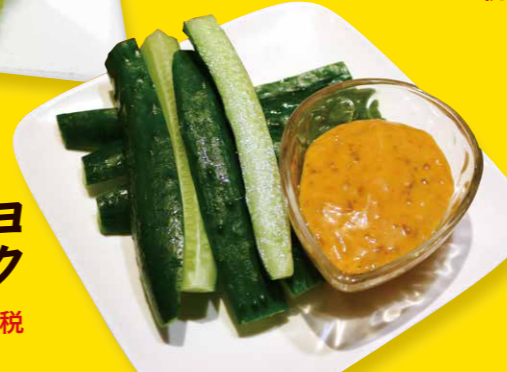
味噌マヨ きゅうりスティック 420円+税