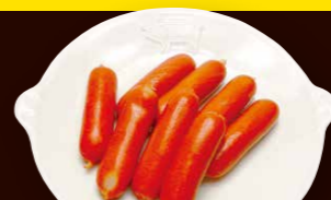
赤ウインナー 380円+税