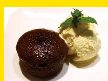
フォンダンショコラ ~バニラアイス添え~ 460円+税