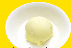
バニラアイス 270円+税