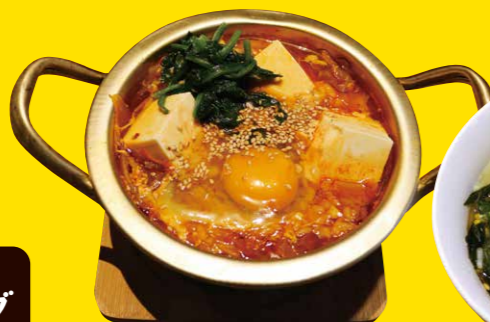
キムチ豆腐クッパ 880円+税